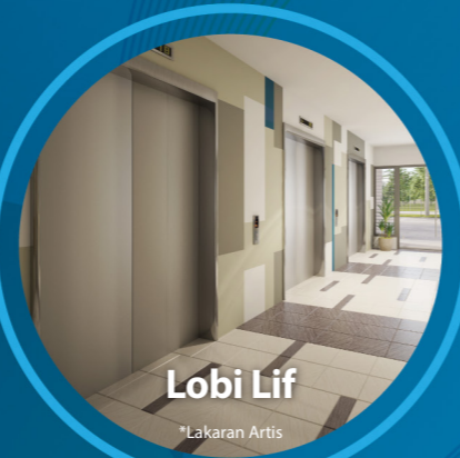
Lobi Lif *Lakaran Artis