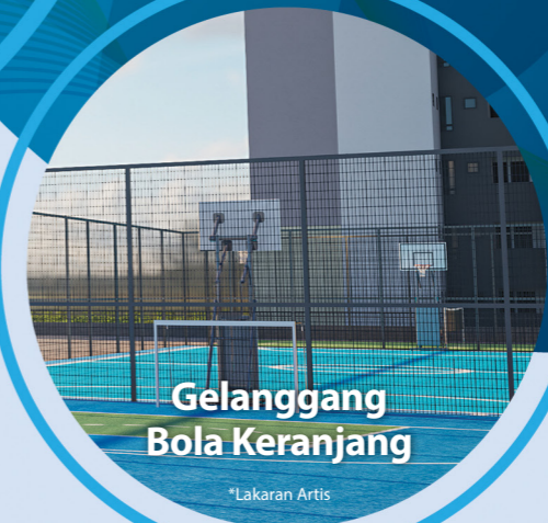
Gelanggang Bola Keranjang *Lakaran Artis