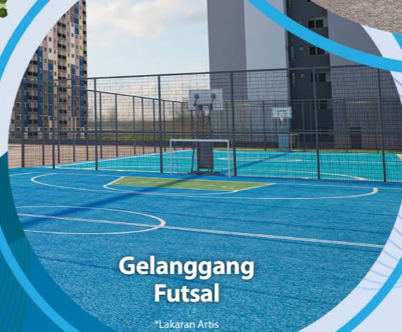
Gelanggang Futsal *Lakaran Artis