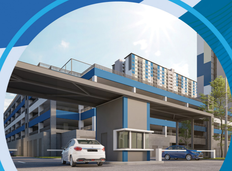
Pondok Pengawal *Lakaran Artis